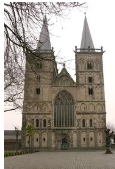
De Dom in Xanten

De haventempel, het indrukwekkende amfitheater, de torens en de thermen komen tot in de kleinste details overeen met hun antieke