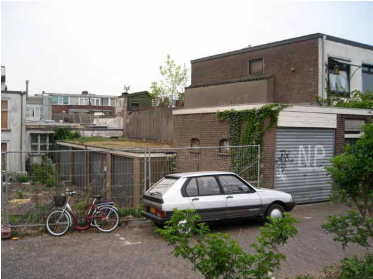
te slopen woning aan de Molenhoek(behoort tot Tolhuiscomplexterrein)

Verhelst, drs.E.M.P., De nederzetting Zandwijk door een rivier gescheiden van Tiel, Bewoningsporen uit de 10 de en 11 de eeuw na Chr. In het plangebied Tiel-Binnenheuvel. ZAR 27