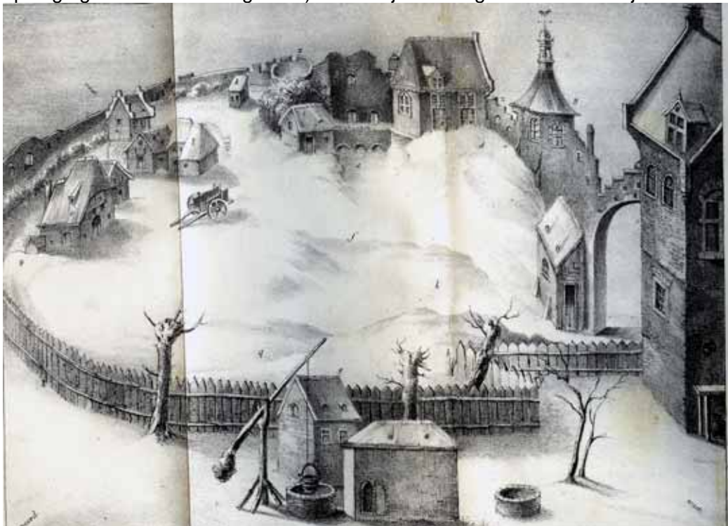
het Tolhuis volgens het RijksArchiefGelderland

1537. "De bevolking van Tiel wachtte de afloop van de gebeurtenissen niet af (probleem opvolging van Karel van Egmond). Kennelijk voorzag men weer vele jaren van militaire