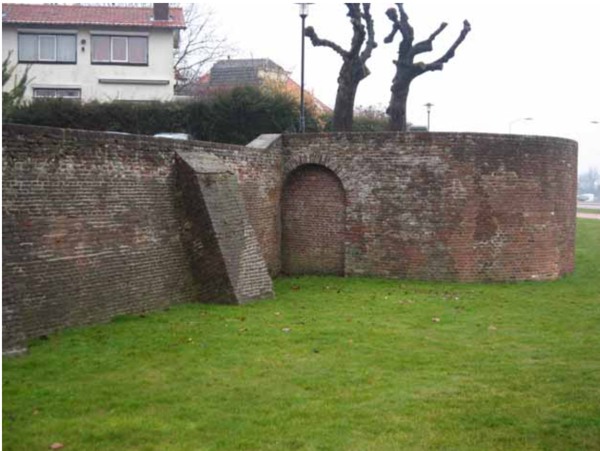
de Poort van de Hertog( het witte huis op de achtergrond staat op de plaats van de Gasthuismolen en men vermoedt hieronder een ronde toren van het Tolhuis)

Het tolhuis fungeerde als citadel of te wel dwangburcht – het was een omsloten domein dat in de stadsmuur een (nog aanwezige) eigen poort had, zodat de landsheer er troepen binnen kon laten buiten de magistraat om en zonder dat daarvoor stadspoorten zouden moeten worden geopend.