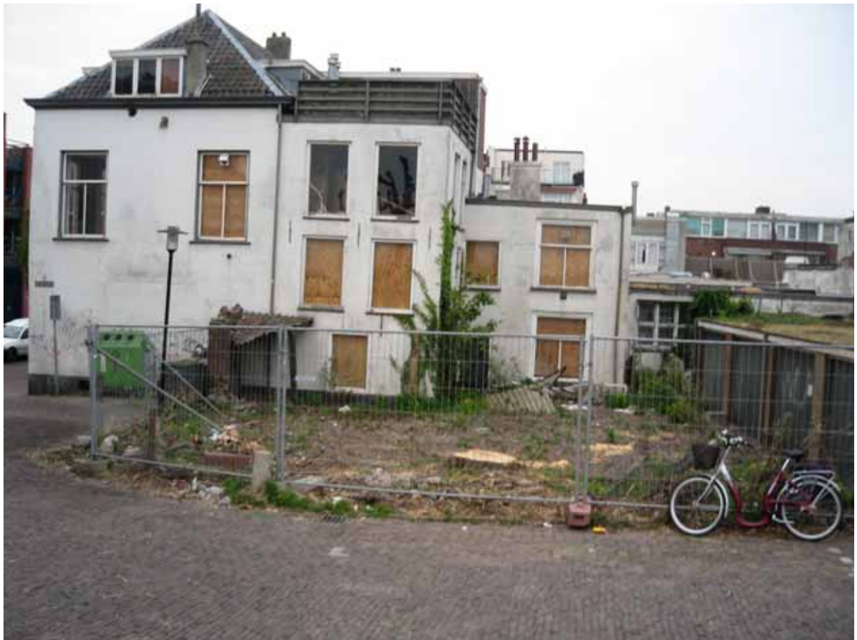
de ambtswoning van de stadhouder uit 1522

het Ambtmanshuis en het Raadhuis. In dit deel van de stad zijn geen andere profane bouwwerken van enig belang bekend dan het Tolhuis. Zeer waarschijnlijk is het naast de Cellebroederskapel aangeduide gebouw dus een laatste restant van het in 1537 gesloopte Tolhuiscomplex.